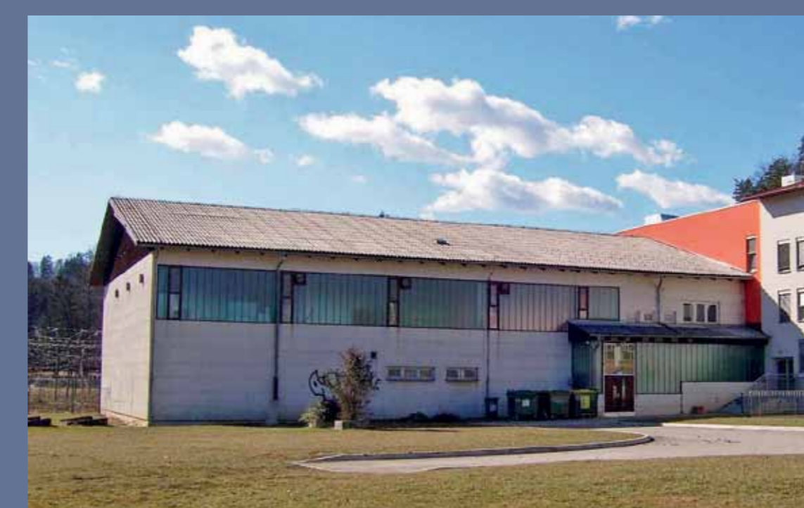
Telovadnica.

Šola je vedno posvečala veliko pozornost slovenski kulturi, zato so člani novinarskega krožka v spomin na Franceta Prešerna na šoli pripravili razstavo najstarejših knjig v Republiki Sloveniji.