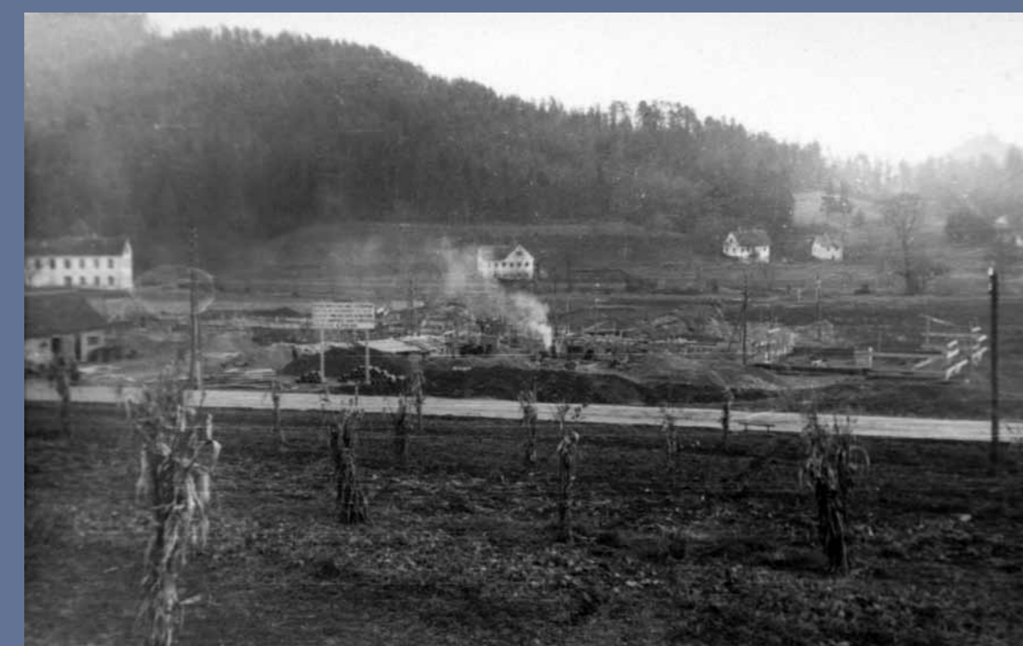
Začetek gradnje osnovne šole.