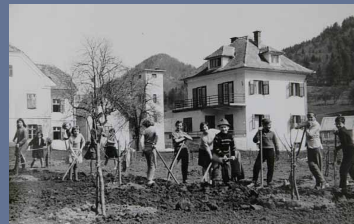
Pionirji hortikularnega krožka urejajo okolico šole.

kot park, del pa kot šolsko njivo (pri urejanju zunanjih površin so od postavitve nove šole do konca šolskega leta 1963/64 učenci izvršili 20 tisoč prostovoljnih delovnih ur). Že naslednje šolsko leto je na regijskem tekmovanju šolskih vrtov vrt OŠ XIV. divizije Dobrna dosegel 2. mesto.