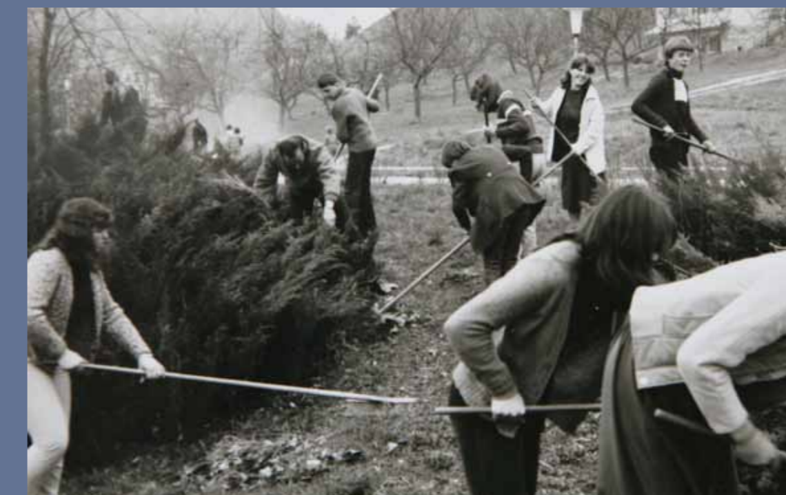
Čiščenje okolice šole.

Vsa leta so občinstvo na Dobrni in tudi na revijah pevskih zborov navduševali učenci iz naše šole. Na republiških revijah so dosegli več priznanj.