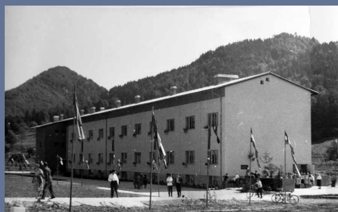
Proslava ob otvoritvi nove šole.