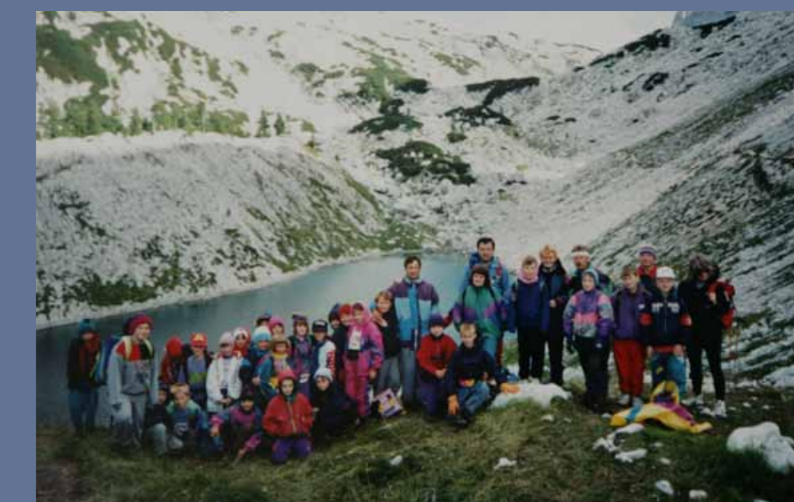
Alpska šola v naravi – učenci v osrčju Triglavskega narodnega parka.