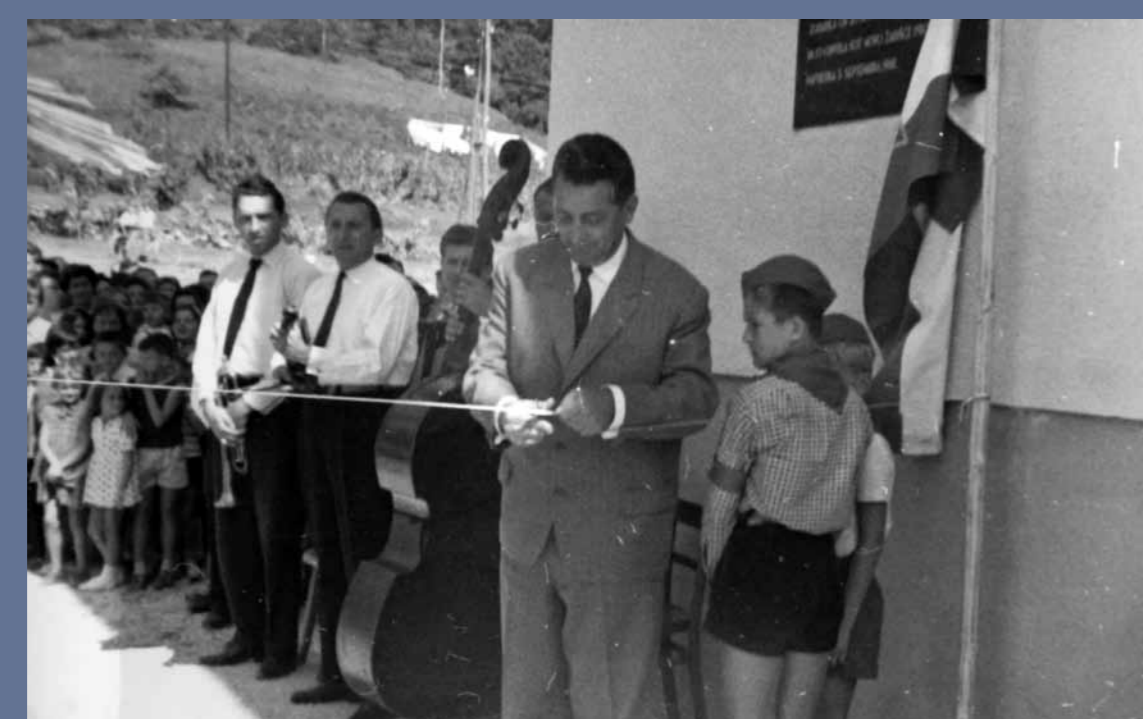
Otvoritev osnovne šole.

Po končani gradnji šole je bilo potrebno urediti še okolico šole, za kar so poskrbeli učenci hortikularnega krožka. Del zemljišča so uredili