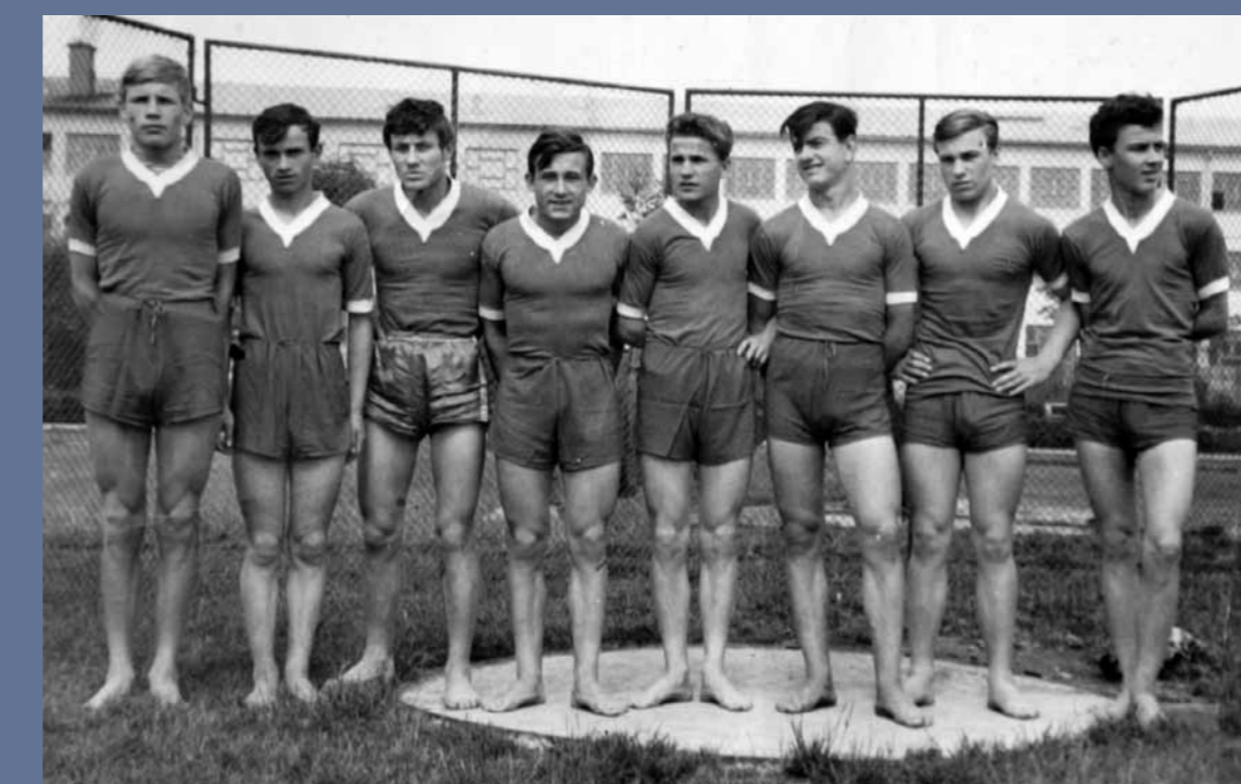
Odlični atleti iz šolskega leta 1959/60.

Čeprav je bilo šolsko športno društvo, ki ga je vodil učitelj Jože Sluga, ustanovljeno šele v šolskem letu 1972/73, so naši učenci dosegali lepe uspehe na različnih športnih tekmovanjih že mnogo prej.