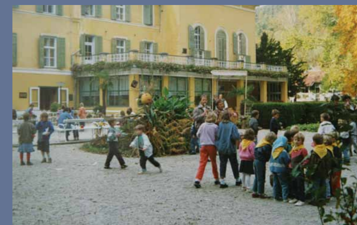
Pozdrav Tetki Jeseni.

Ob koncu koledarskega leta so učitelji skupaj z učenci prirejali različne praznične koncerte, med katerimi so bili posebej dobro obiskani tisti v jami Ledenici. Poleg glasbenih nastopov učencev so si obiskovalci lahko ogledali tudi žive jaslice.