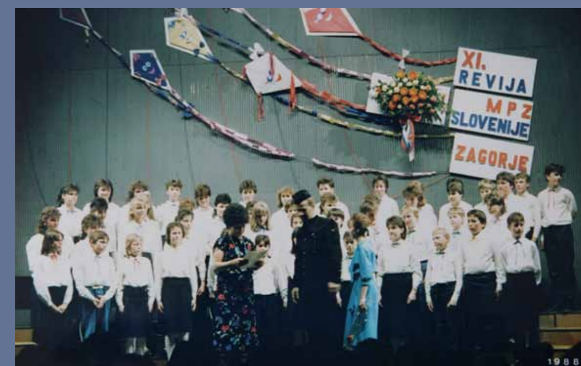
Sodelovanje pevskega zbora na republiški reviji.

Praznovanje Tetke Jeseni je zaznamovalo mnoge generacije učencev prvega in drugega razreda. Tetka Jesen je tako obložila mize z jesenskimi dobrotami vsako jesen.