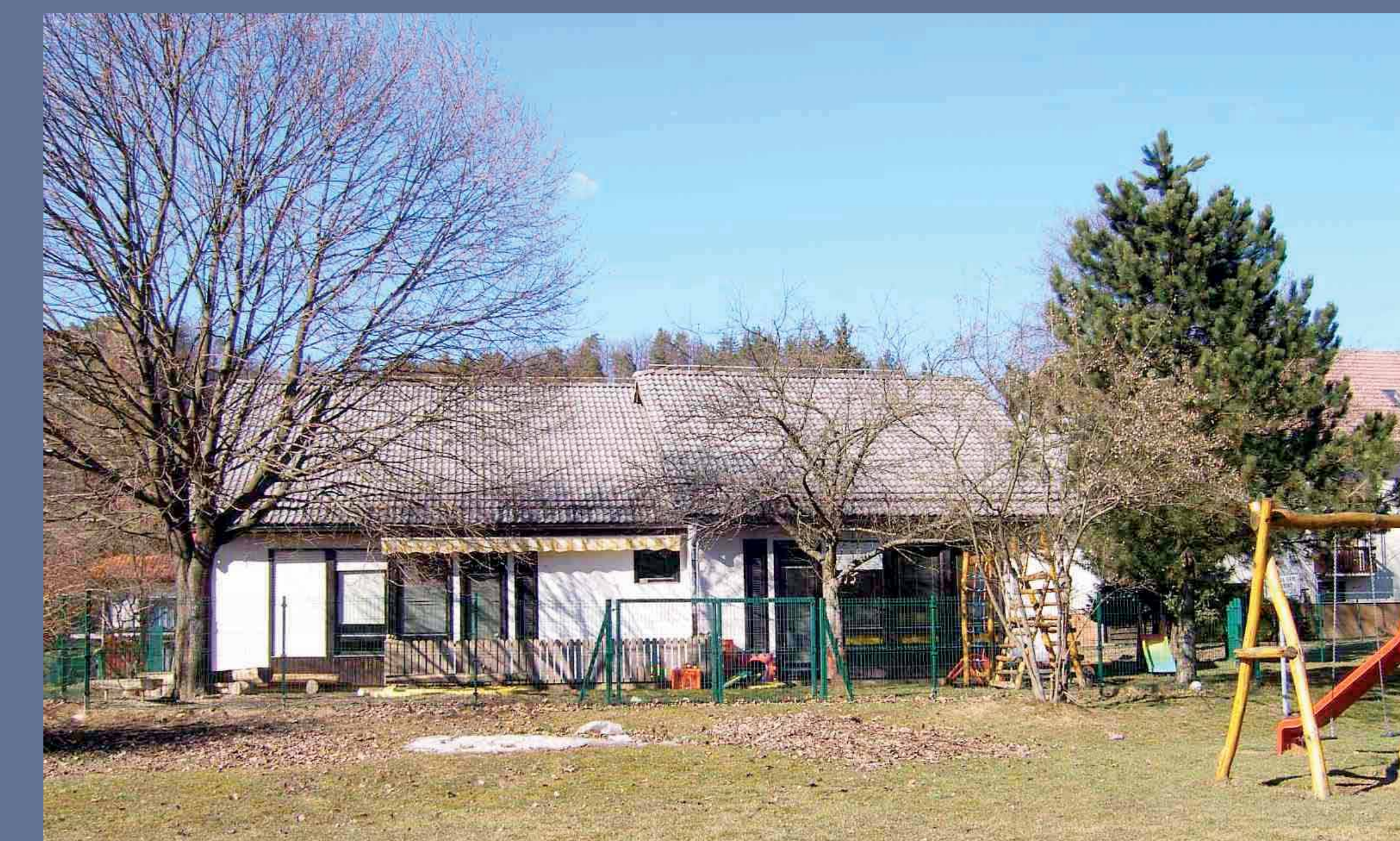
Vrtec Dobrna, dograjen 1984. leta.