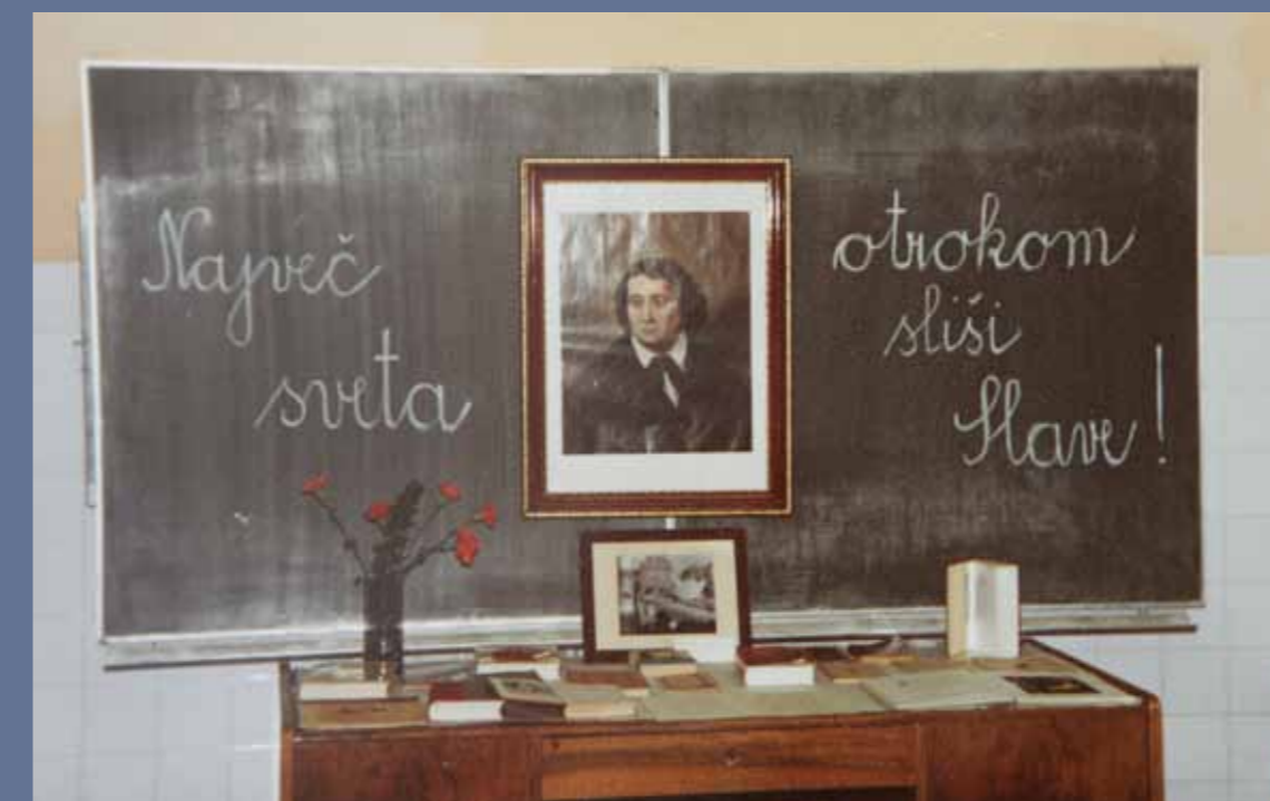
Razstava najstarejših knjig ob praznovanju 8. februarja.

grmovnicami. V šolskem letu 1981/82 je bil del travniške površine pri šoli spremenjen v spominski park. Učenci so zasadili 88 dreves za tovariša Tita.