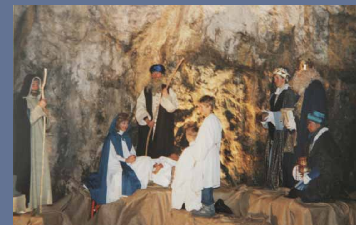
Žive jaslice v jami Ledenici.

primorje. Leto kasneje je zaživela alpska šola, ki je postala naša stalnica. Učenci se je radi udeležujejo zaradi čudes, ki nam jih ponuja alpski svet. Istega leta so osmošolci prvič odšli na tridnevno ekskurzijo Koroška – Voranc.